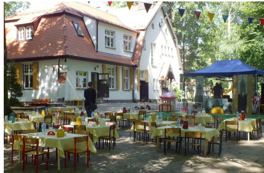
Królewna śnieżka w przedszkolu